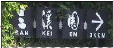
パン屋の左前に見える看板 あと300メートル