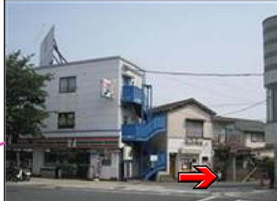
セブンイレブン横の道を入ります。 ここから600メートル