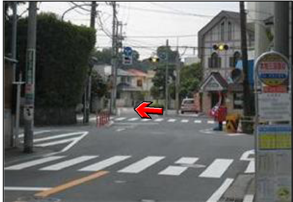
横浜駅東口 市バス《8・148系統》35分 「本牧三溪園前」下車徒歩約3分 バスを降りて振り返ると交差点が見えます。