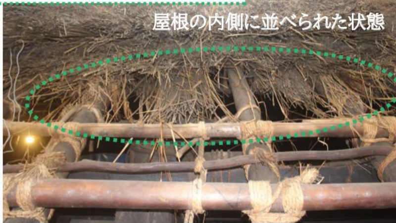
屋根の内側に並べられた状態