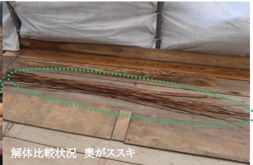
解体比較状況 奥がススキ

屋根の一番内側に、ススキとは違う素材（おそらくヨシ？）が敷き詰め並べられている状況が確認されました。こちらは資料調査では類例が確認されず用途が不明で、また材料確定の根拠が得られませんでした。今後材料の調査として専門家に依頼し植物の同定を実施するほか、用途確認のため類例調査をさらに進めて行きます。