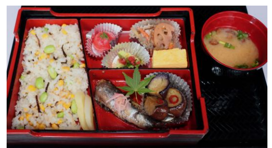
待春軒「夏の朝ごはん」1,800円 50食限定