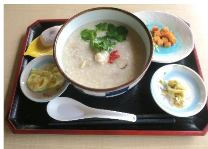
雁ヶ音茶屋「中華がゆ」1,200円