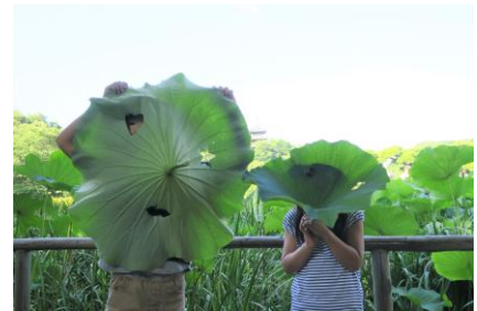
葉っぱのお面づくり