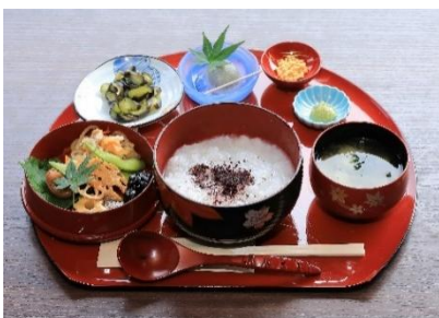
三溪園茶寮「朝がゆ」1,600円 100食限定